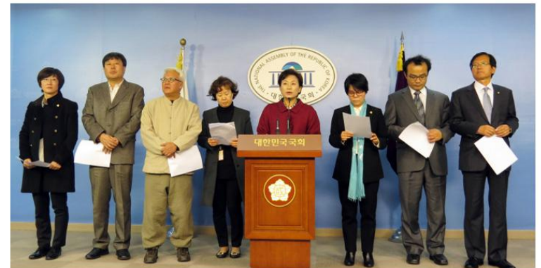
협동조합 활성화를 위한 『협동조합 기본법 일부개정법률안』 발의